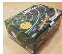
日本語の説明書付きです😊