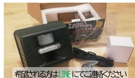
希望される方はLINEにてご連絡ください

なお、申し込み多数の場合は、先着順とさせていただきます。効果や状況によっては、予算の範囲内で助購入する予定です。